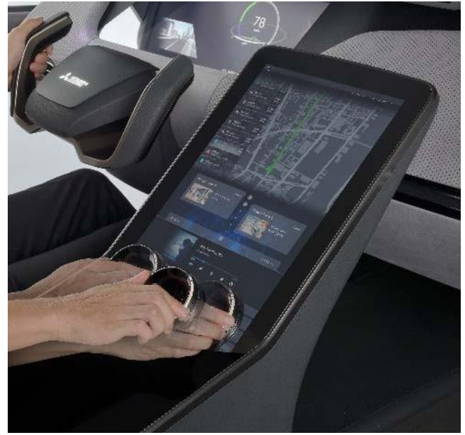
Gösterge üzeri düęme