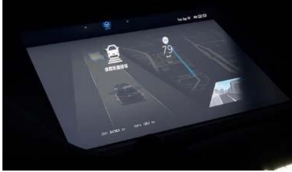
Çapraz görüntü göstergesi