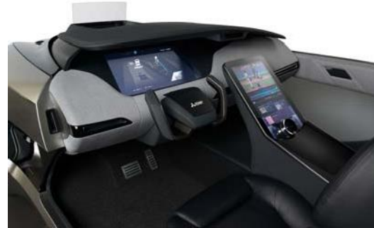
EMIRAI 4 iç görünüm

"Sizinle birlikte hissetmek; herkes için uygun, güvenli ve konforlu" teması altında, yeni konsept otomobilin geliştirilmesi üç spesifik araştırma alanını hedefliyor: elektrifikasyon, sürücüsüz kullanım ve bağlantılı olma. EMIRAI 4'te insan makine arayüzü (HMI), sürücü algılama ve aydınlatma sistemi gibi yeni nesil sürüş yardım teknolojileri bulunuyor. EMIRAI 4 tasarımında yer alan HMI yenilikleri arasında şunlar bulunuyor: