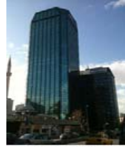
Mitsubishi Electric Türkiye genel merkezi Maya Akar Center

Türkiye’de büyüyen orta sınıfın ve çalışan büyük nüfusun harcamaları sayesinde milli hasıla 2011’de 774 milyar USD’a yükseldi ve dünyanın en büyük 18. ekonomisi oldu. Türkiye’de milli hasıla reel büyüme oranı da 2011’de %8.5 gibi yüksek bir rakama ulaştı, 2012 ve sonrasında istikrarlı şekilde %2-4 artacağı tahmin ediliyor. Mitsubishi Electric bu büyüme potansiyelini dikkate alarak Türkiye’yi öncelikli pazar kabul ediyor.