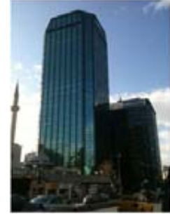
Mitsubishi Electric Türkiye genel merkezi Maya Akar Center