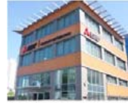
Yeni Türkiye FA Merkezi, Ümraniye

Avrupa’nın en büyük nüfuslu üçüncü ülkesi olan ve gayri safi milli hasılası hızla büyüyen Türkiye’nin ekonomisinin güçlü büyümesi, özellikle de otomotiv ve gıda sektörlerinde büyümesi bekleniyor ve FA pazarının her yıl % 10 büyüyeceği tahmin ediliyor. Büyük Japon üreticileri faaliyetlerini arttıracak ve sonuçta FA ürünlerine ve servis hizmetlerine duyulan talep artacak. Mitsubishi Electric, Türkiye’deki FA faaliyetlerini Haziran 2013’te beş şubede 42 çalışanla başlattı. FA ürün desteği bu güne kadar yerel distribütörler ve Polonya’daki Avrupa FA Merkezi vasıtasıyla verildi. Bu yeni merkezin kurulmasıyla ülke genelinde verilen FA ürün hizmetlerini büyük oranda hızlandırması ve genişletmesi bekleniyor.