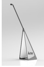
Kablosuz güvenlik kamerası

Mitsubishi Electric Corporation (TOKYO: 6503) güvenlik kameraları için güç kablosuna veya kablolu LAN'a ihtiyaç duyulmadan görselleştirme yazılımıyla kablosuz kameralara bağlantı yapılması sayesinde kullanıcıların bir ağ kurmalarını mümkün kılan multihop teknolojisinin kullanıldığı bir kablosuz ağ sistemini geliştirdi.