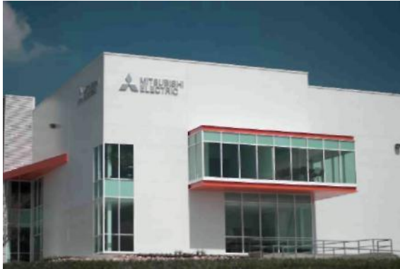
Mitsubishi Electric Automation, Inc.'in Querétaro Ofisinde bulunan Meksika FA Merkezi.

TOKYO, 12 Mayıs 2017 – Mitsubishi Electric Corporation (TOKYO: 6503) bugün Meksika iştirakinin Queretaro'da bulunan Meksika FA Merkezi ve Nuevo Leon'da bulunan Meksika Monterrey FA Merkezi olmak üzere iki yeni fabrika otomasyonu (FA) servis merkezi kurduğunu açıkladı. Genişletilen ağ sayesinde, Mitsubishi Electric'in Meksika'da FA ürünlerinin servisinin yanı sıra müşteri desteğini güçlendirmesi ve hızlandırması mümkün olacak. Her iki merkez de 15 Mayıs'ta faaliyete geçecek.