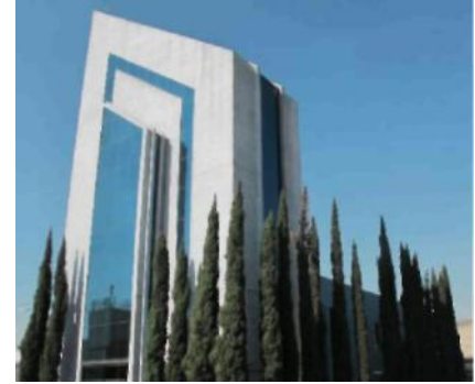
Mitsubishi Electric Automation, Inc.'in Mexico Şubesinde bulunan Mexico City FA Merkezi