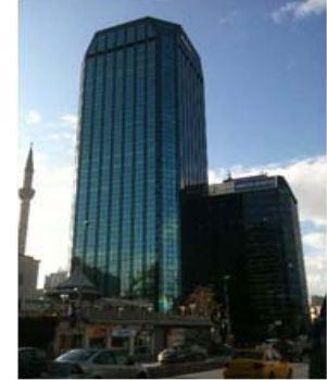
Mitsubishi Electric Türkiye genel merkezi Maya Akar Center