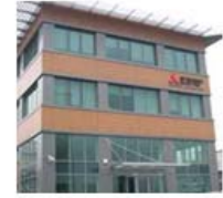
Sanayi otomasyon faaliyetleri merkezi olan eski GTS binası

Mitsubishi Electric bu yeni yapı bünyesinde sanayi otomasyon satışlarını öncelikli pazarlarından biri olan Türkiye’de 2016 Mart ayı itibarıyla sona eren mali yılda 3 milyar Yen’e yükseltmeyi hedefliyor. Mitsubishi Electric Türkiye daha da büyümek için komşu ülkelere satış yapmayı da hedefliyor. Mitsubishi Electric Türkiye ayrıca Mitsubishi Electric’in Türkiye’deki diğer faaliyetlerinin genişletilmesine destek verecek, bu kapsamda klima cihazları bulunuyor, yanı sıra uydular, asansörler, yürüyen merdivenler, vagonlar için elektrikli donanımlar ve elektrik güç sistemleri gibi altyapı donanımları bulunuyor.